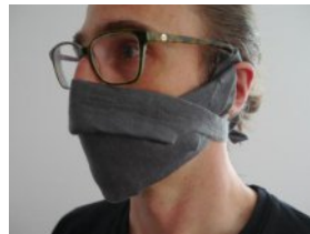
MNS 2, grau