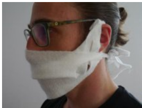
MNS 1, weiß